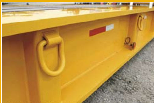
Argollas para sujetar la carga.