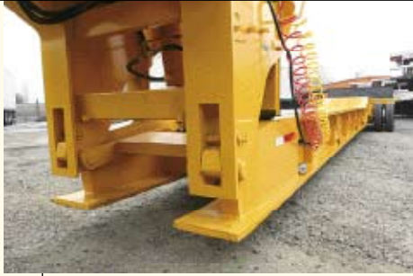
Vista delantera del cuello. Muestra puntos críticos que sufren mayores esfuerzos.