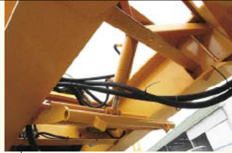
Soporte de sustentación que permite el apoyo del cuello al chasis del camión. El ajuste se realiza a través de un cilindro hidráulico con pieza de apoyo.