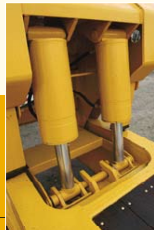
Cilindros de elevación de la plataforma.