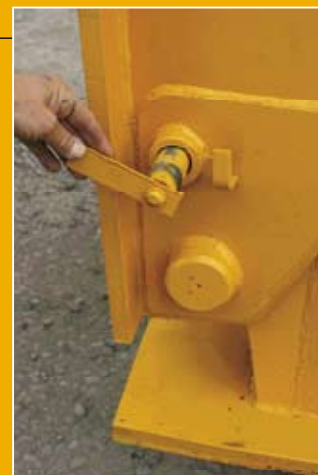
Pasador de seguridad del cuello desmontable.