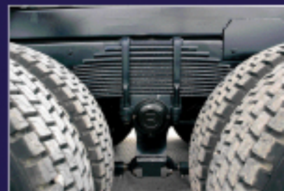
Suspensión trasera con paquetes semielípticos en tandem Invertido.