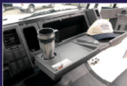
Comodidad y ergonomía en la cabina.