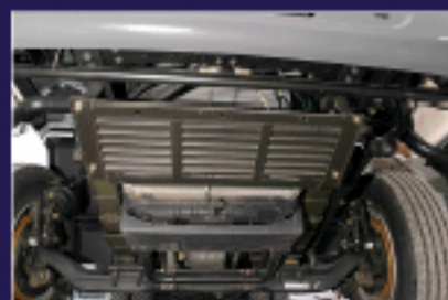
Protector frontal inferior del intercooler, sistema de enfriamiento, ventilador y radiador.