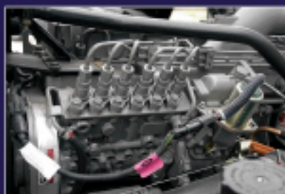
Bomba inyectora Bosch en línea, con nueva posición de solenolde de parada.

Al éxito indiscutido de Ford en su línea de camiones 6x4, hoy se le une el modelo Cargo más esperado: el 2831 para 50 toneladas, en versiones tolva, tracto y forestal.